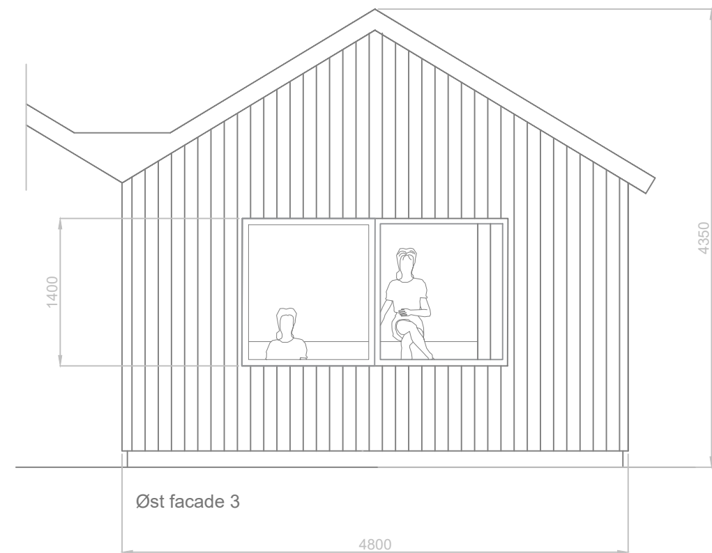
Øst facade 3