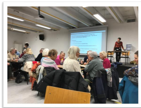
Generalforsamling: Mange deltagere og livlig debat

Bestyrelsen samler op på det hele og udarbejder retningslinjer, som kan bidrage til den bedste anvendelse af faciliteterne.