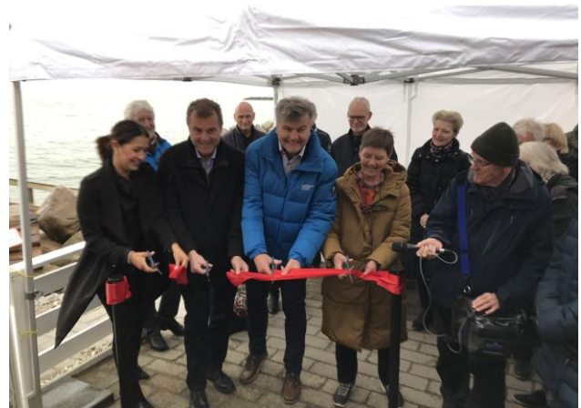
Snoren klippes ved indvielsen den 6. april

Den 5. februar markerede vi ibrugtagningen med et velbesøgt morgenarrangement med boblevin og croissanter.