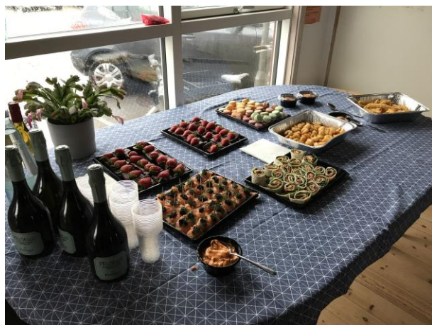
Fornem serveringen ved indvielsen