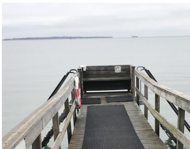
Stille morgen på broen den 5. november 2024

Bestyrelsens udgangspunkt er, at når vores kommune stiller de givne faciliteter til rådighed for klubben, gælder det om at vi som klub anstrenger os for at så mange som muligt af de interesserede, får adgang.