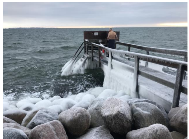
En kold morgen den 7. januar 2024

Den 1. oktober åbnede vi for 214 nye medlemmer. Bestyrelsen bød velkommen til dem, som mødte op til et kort intro-arrangement den 29/9 med rundvisning og orientering om klubben samt udlevering af låsearmbånd. Der var tydelig glæde over medlemskabet, og store forventninger til livet som vinterbader i vores klub med adgang til de faciliteter, vi kan tilbyde i kraft af vores brugeraftale med Fredensborg Kommune. Velkommen til alle nye, og tak alle "gamle" for at tage rigtig godt imod vores nye medlemmer.