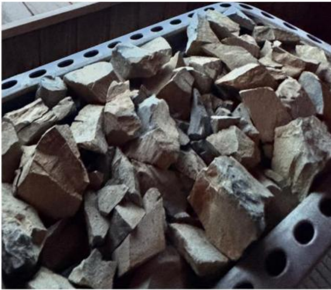
Vores gamle ødelagte saunasten